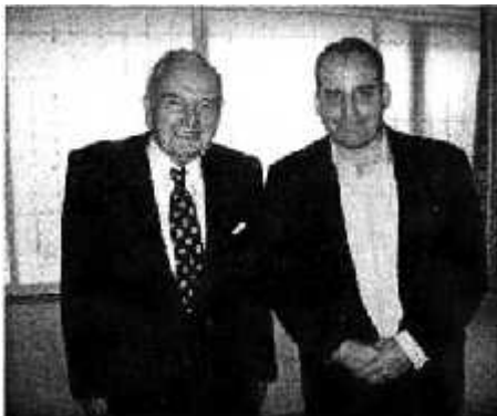
Obr. 25; David Rockefeller a Benjamin Fulford během rozhovoru, rok 2007.

Fulford tvrdí, že prý si ho špičky nejmocnějších asijských klanů vybrali k tomu, aby vyjednával s rodinami na západě a předával jim od Asiatů poselství. Ta uvádějí, že na Zemi začala nová éra a že se nebude trpět zotročování lidstva ze strany západní bankovní elity.