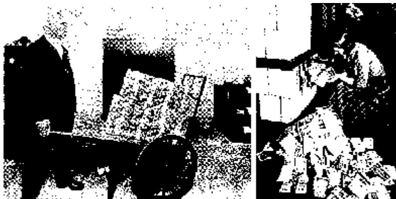
Obr. 3 a 4:

Německo ve dvacátých letech: Peníze byly bezcenné. Než za ně kupovat topivo, spíše se vyplatilo je rovnou spálit.