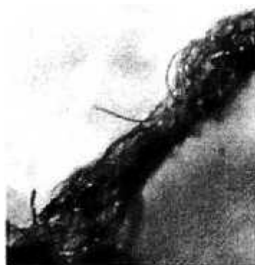
Obr. 14: Síť nanovláken.

„Vlákna, jež prší z nebe, vypadají jako nejjemnější cukrová vata“, vysvětluje Dr. Staninger. Jedná se o spojení nanočástic. Jednotlivé součásti jsou pouhým okem neviditelné.