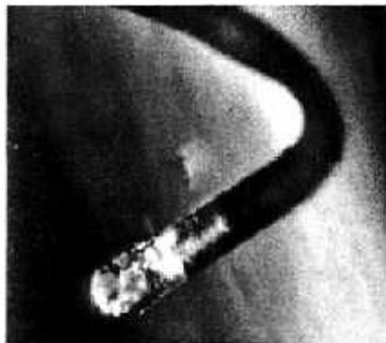
Obr. 13: Hlavička vlákna Morgellona.